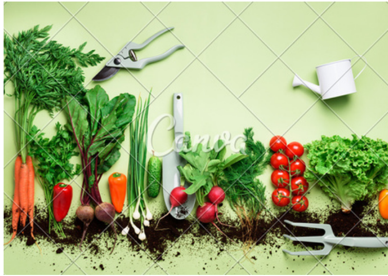
Cultiver le potager

L'Oasis de la Saye aspire à sensibiliser les visiteurs à la nature et au monde qui nous entoure.