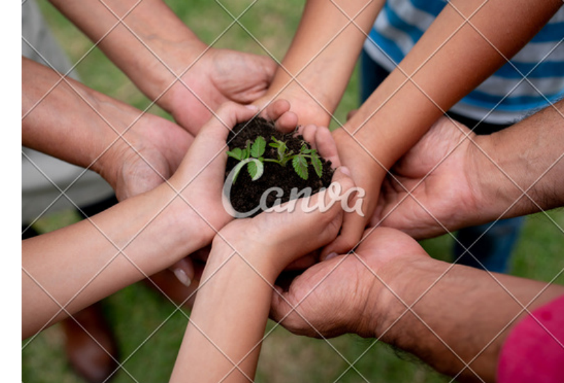
Prendre soin du vivant, sensibilisation à l'écologie profonde et au travail qui relie

L'Oasis de la Saye à pour ambition de proposer :