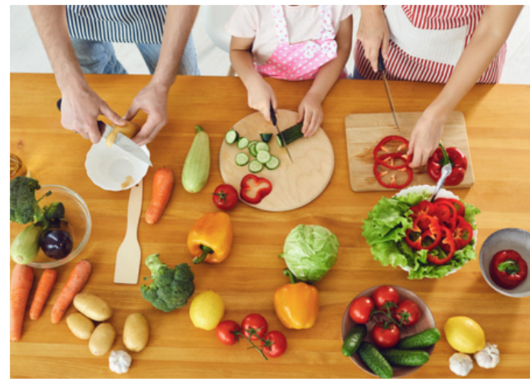
Cuisiner local ensemble