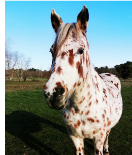
Animaux, pour se relier et s'apaiser