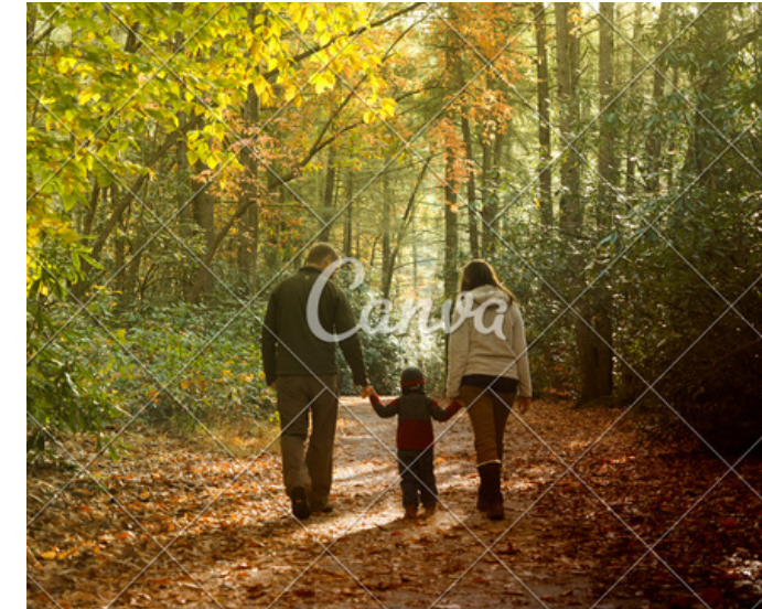
Balades en forêt